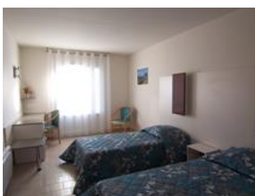
chambre des Oliviers