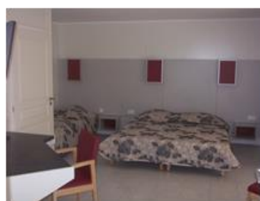
chambre des Ecreuils